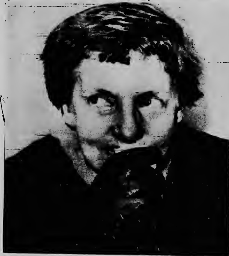
Anna Anderson su peticion pa ser reconece como e yiu muher di e ultimo zar Ruso a ser rechaza door di un corte ayera pasobra e no por a proba cu e ta e ultimo Romanov cu a scapa di e mannan asesino di Bolchevikenan 49 aña pasá.

Esaki a nenga di somete sumes na un examen ruso pa demostra com e por papia y domina e idioma ey. E demandante a bisa cu despues di 49 anja cu el a biba foi su pais natal, el a lubida masha tantu palabra dje idioma ey..